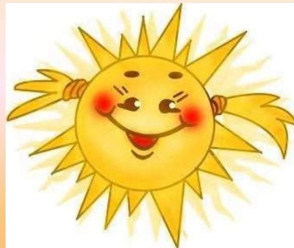
Luz y calor