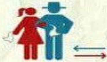
Invitación y paseo