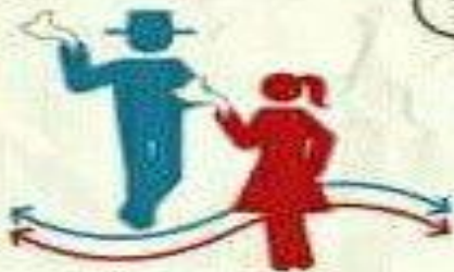
Cambio de lado