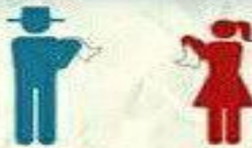
Palmas de frente