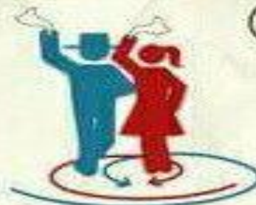
Vuelta de acercamiento