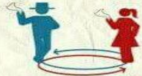
Vuelta en círculo