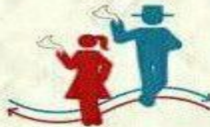
Cambio de lado