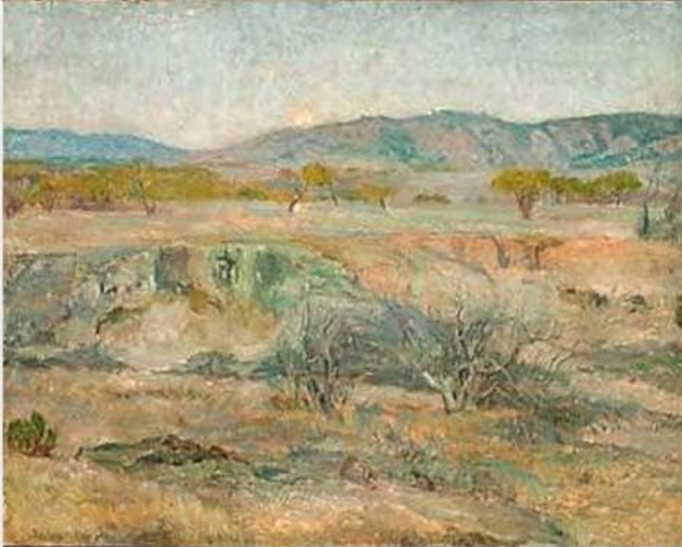
Campo agreste - Alberto Valenzuela Llanos