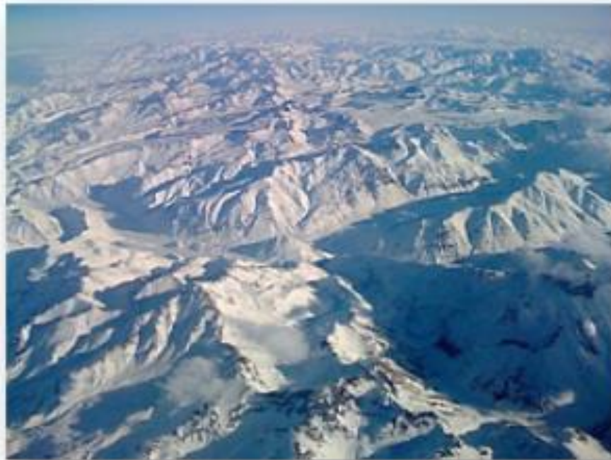
Cordillera de Los Andes vista desde el aire