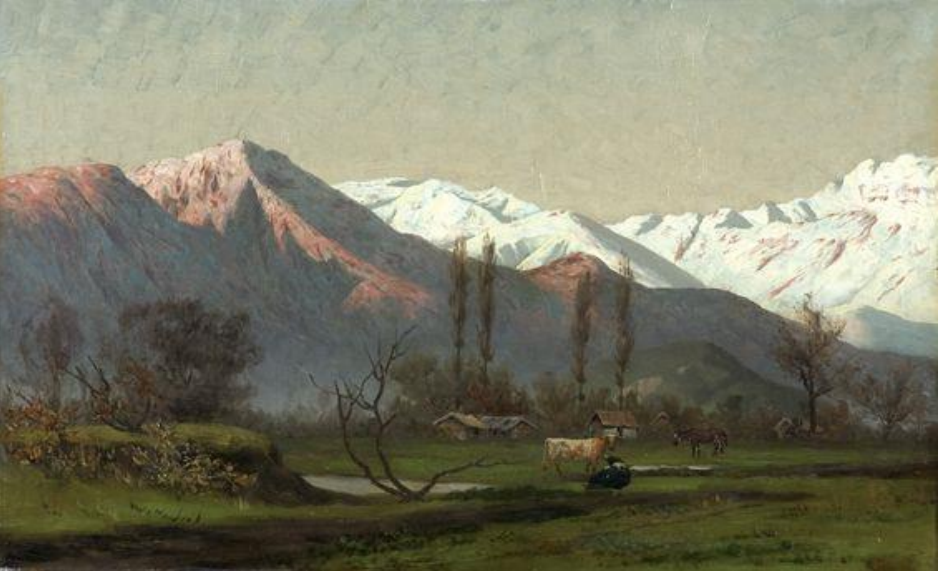
Paisaje con cordillera y vacunos - Pedro Lira