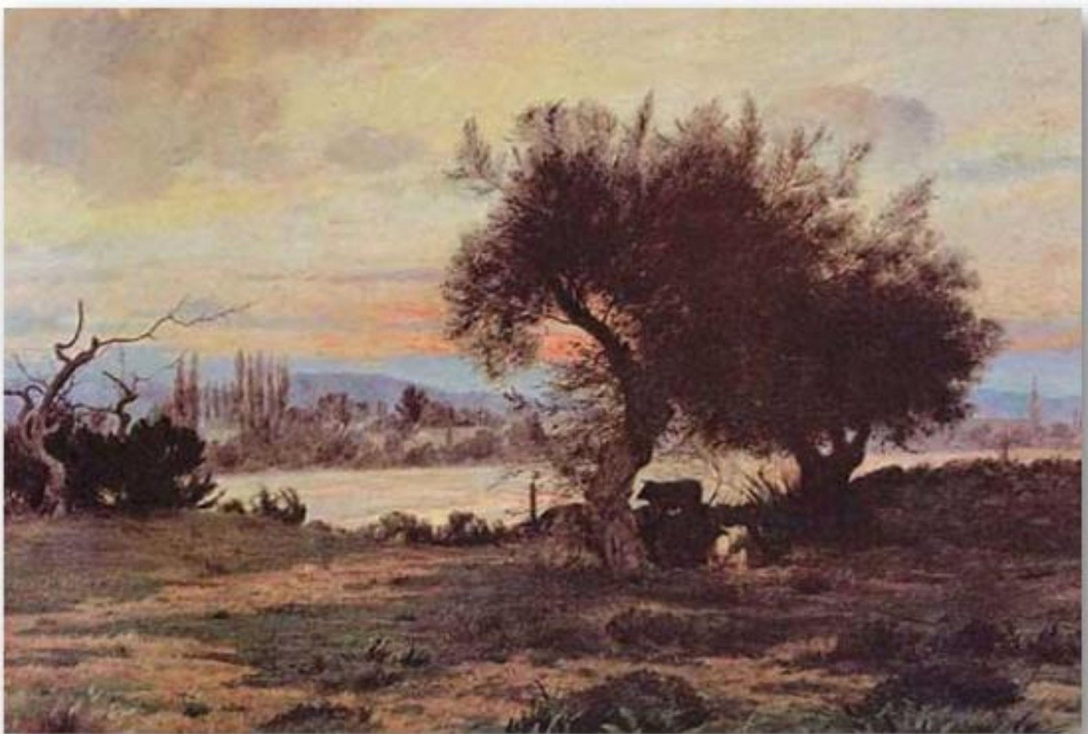
Paisaje crepuscular - Pedro Lira