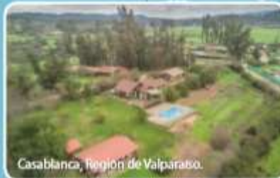
Casablanca, Región de Valparaíso.

Zona Central: se extiende desde el río Aconcagua hasta el río Biobío.