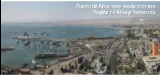
Puerto de Arica visto desde el morro, Región de Arica y Parinacota.

En otros paisajes conviven elementos naturales y culturales.