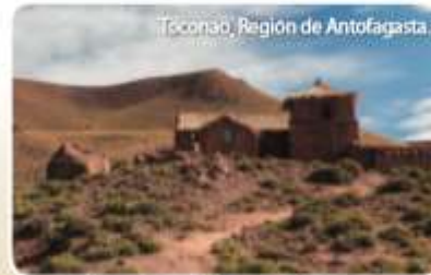
Ticonao, Región de Antofagasta.

Zona Norte: se extiende desde el límite norte de Chile hasta el río Aconcagua. Es una zona extensa y se divide en Norte Grande y Norte Chico.