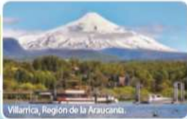
Villarrica, Región de la Araucanía.

Zona Sur: se extiende desde el río Biobío hasta el golfo Corcovado.