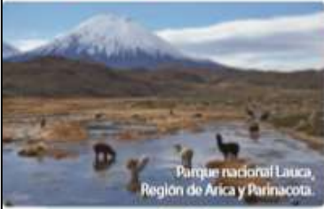
Parque nacional Lauca, Región de Arica y Parinacota.

Existen paisajes donde la presencia de elementos naturales es mayor.