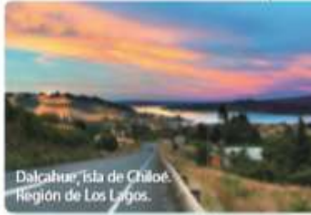
Dalcahue, Isla de Chiloé, Región de Los Lagos.

Existen paisajes donde la presencia de elementos naturales es mayor.