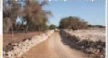
Pampa del Tamarugal, Región de Tarapacá.