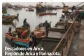
Pescadores en Arica, Región de Arica y Parinacota.

La mayoría de la población de esta zona vive en la costa. La cordillera de la Costa es alta y cae abruptamente al mar.