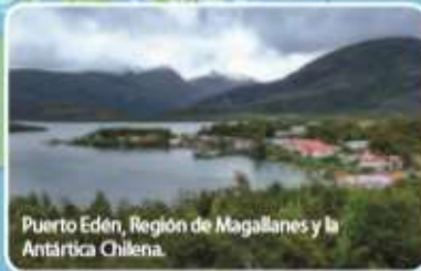
Puerto Edén, Región de Magallanes y la Antártica Chilena.

Zona Austral: abarca desde el golfo Corcovado hasta el extremo sur de Chile.