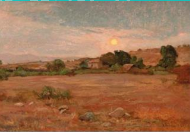
Puesta de sol - Alberto Valenzuela Llanos