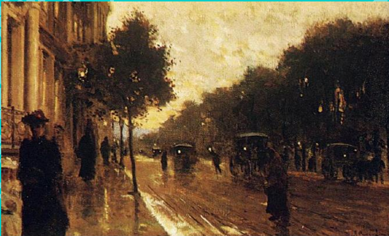
Alameda de las Delicias - Alberto Orrego Luco

Este paisaje de la ciudad de Santiago, ¿es de ahora o es antiguo? ¿por qué?