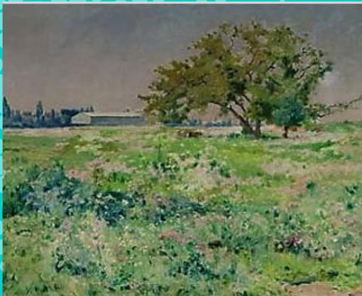
Naturaleza en flor - Alberto Valenzuela Llanos