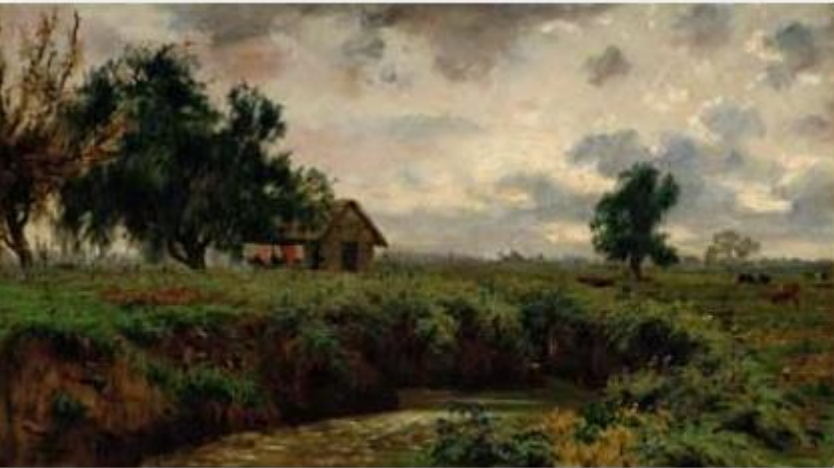
Paisaje campestre - Pedro Lira