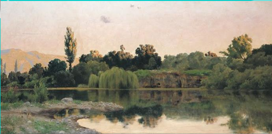
Atardecer en el estanque - Pedro Lira