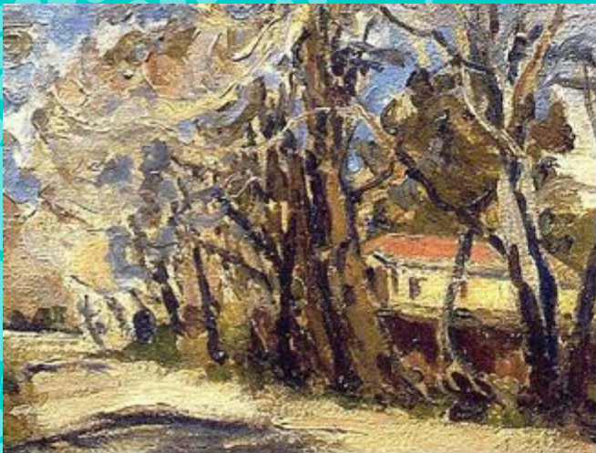
Calle de Melipilla - Juan Francisco González