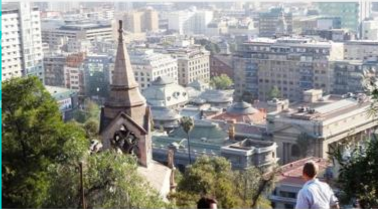
Panorama de Santiago en la actualidad

La pintura nos permite conocer nuestro pasado.