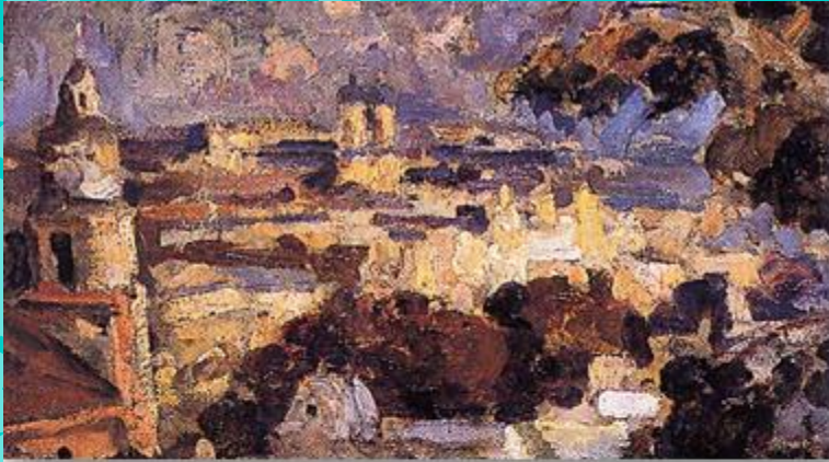
Panorama de Santiago - Juan Francisco González