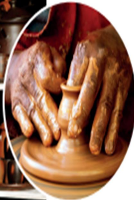
Artesanía en greda, Pomaire. Zona Central