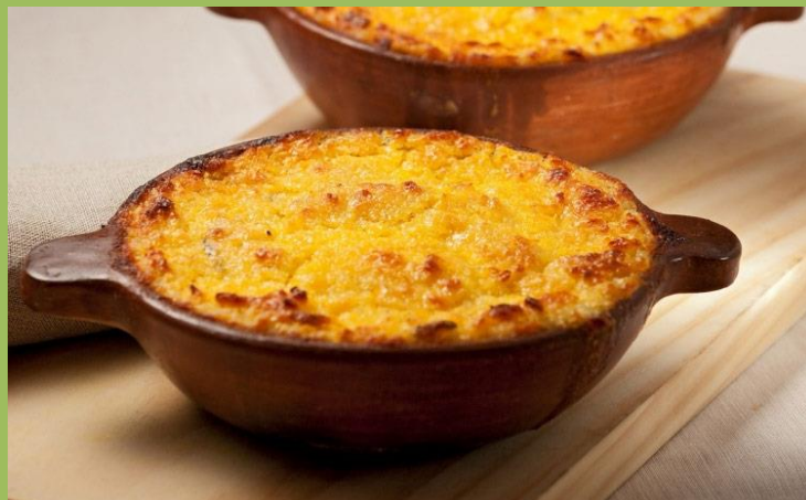
Pastel de Choclo