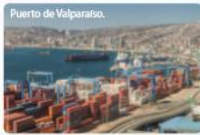
Puerto de Valparaíso.

Recurso 1 Los paisajes de la Zona Central.