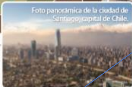
Foto panorámica de la ciudad de Santiago, capital de Chile.

Existen grandes ciudades donde vive gran parte de la población de Chile. Por ejemplo: Santiago, Valparaíso y Concepción.