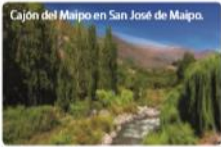
Cajón del Maipo en San José de Maipo.

La cordillera de los Andes tiene altas cumbres y de ella nacen ríos que desembocan en el mar (océano Pacífico). A medida que se avanza hacia el Sur la vegetación aumenta.