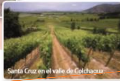
Santa Cruz en el valle de Colchagua

1 ¿Por qué la vegetación es más abundante en esta zona que en la Zona Norte?