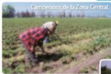
Campeñinos de la Zona Central.

Los puertos en las ciudades de la costa permiten el comercio con países de otros continentes.