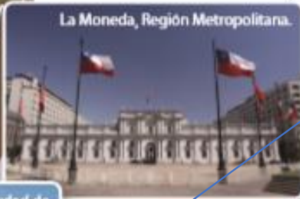
La Moneda, Región Metropolitana.

Existen grandes ciudades donde vive gran parte de la población de Chile. Por ejemplo: Santiago, Valparaíso y Concepción.