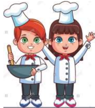
They are chefs