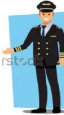
He's a pilot