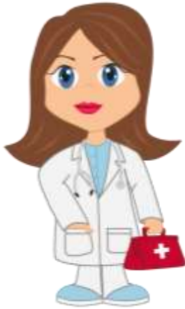
She's a doctor