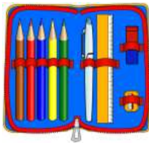
My pencil case