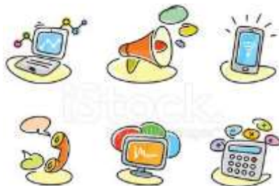
Some electronic device