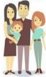
Familias de acogida