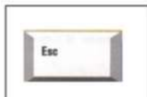
Dibuja la tecla ESCAPE.