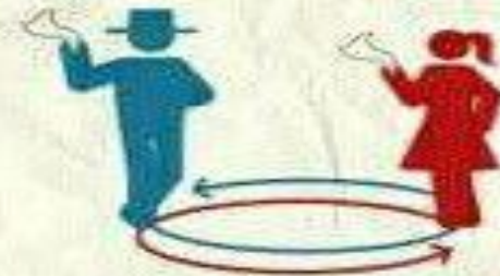
Vuelta en círculo