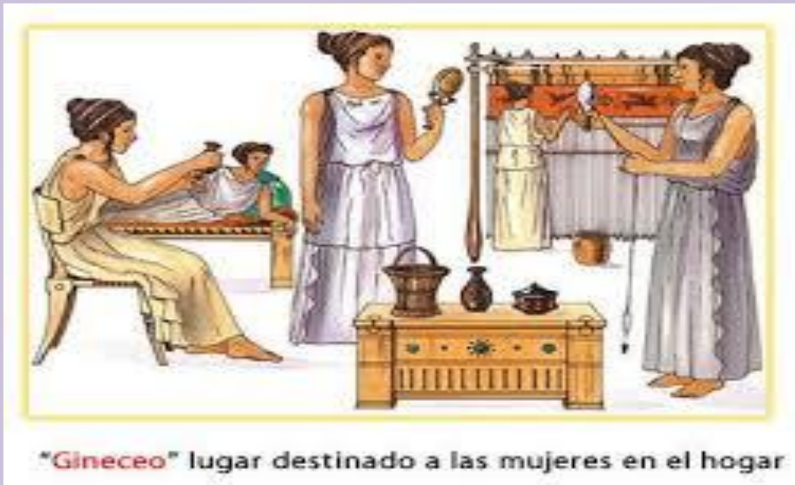
"Gineceo" lugar destinado a las mujeres en el hogar