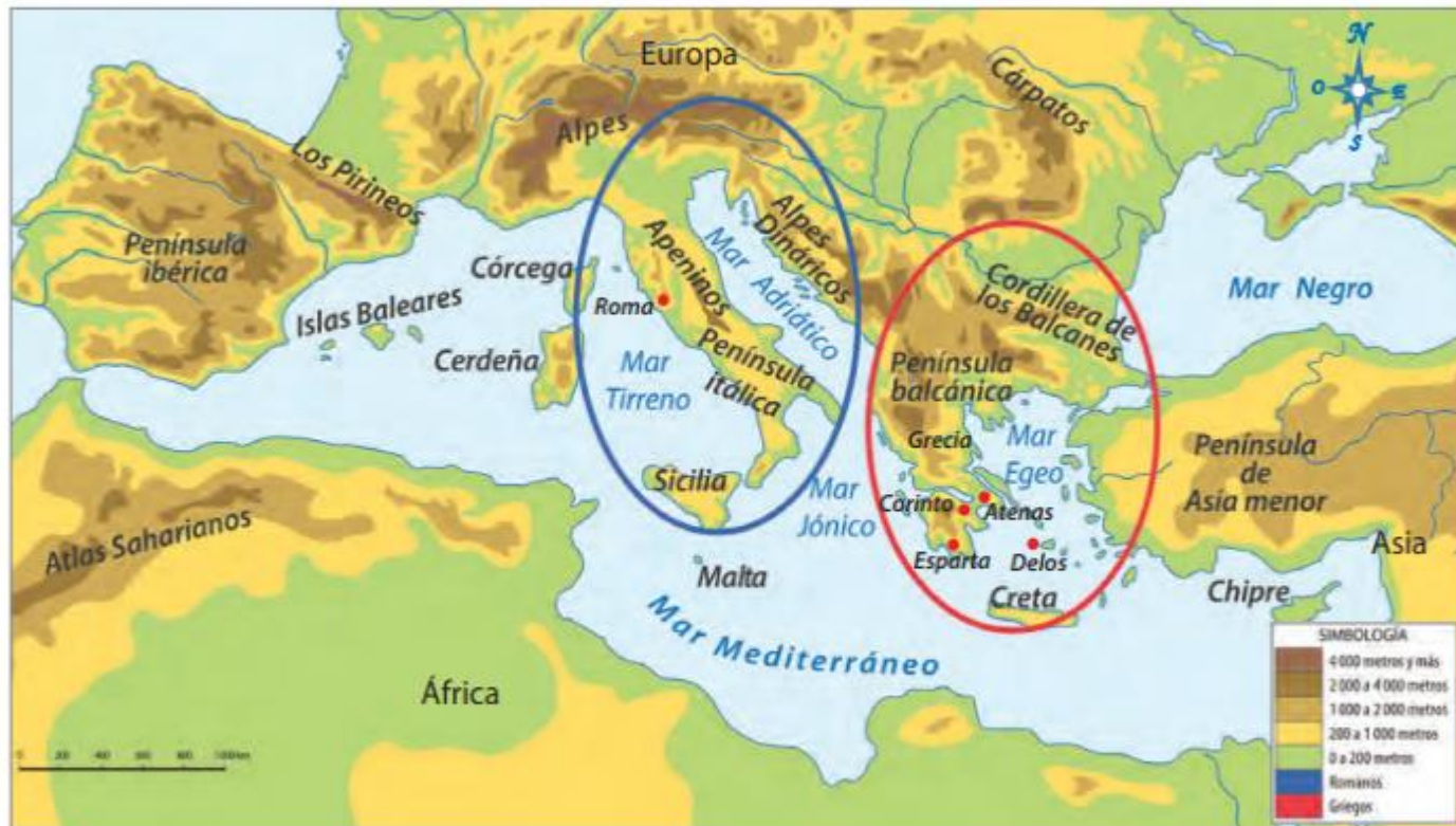
Entorno del mar Mediterráneo

Si bien las culturas griega y romana no constituyeron países, como Chile, se localizaron en espacios geográficos definidos en los alrededores del mar Mediterráneo. De ellas, la cultura que primero surgió fue la griega, que influyó a los romanos en muchos aspectos de la vida diaria.