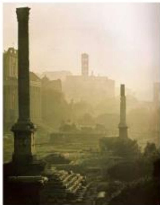
El Foro, centro cívico de Roma.