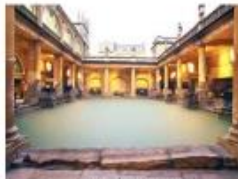
Baños de Bath.