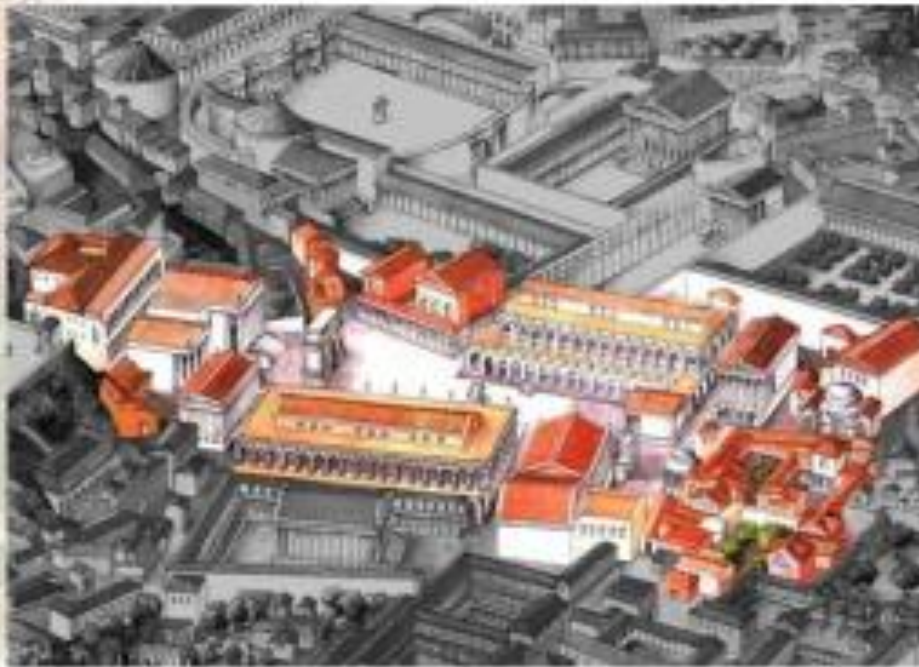
Reconstrucción del Foro romano.