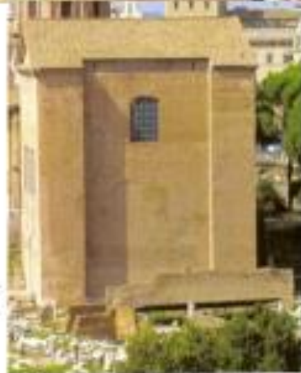
Curia Julia, residencia del Senado.