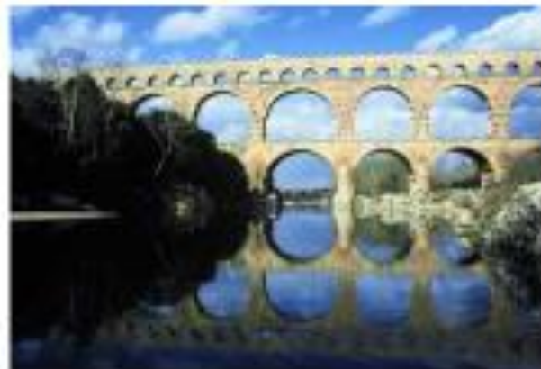
Acueducto de Pont du Gard.

Por su parte, Roma ofreció a las provincias conquistadas un conjunto de elementos, instituciones y principios que sirvieron a otorgar homogeneidad e integración al Imperio. Entre ellas hay que considerar: la lengua, el derecho, las construcciones (coliseos, acueductos, baños), la ciudadanía, etc.