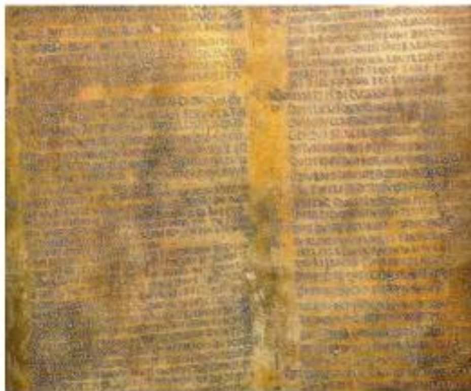
Tábula Claudina, mediante la cual se concedió ciudadanía a los galos (48)