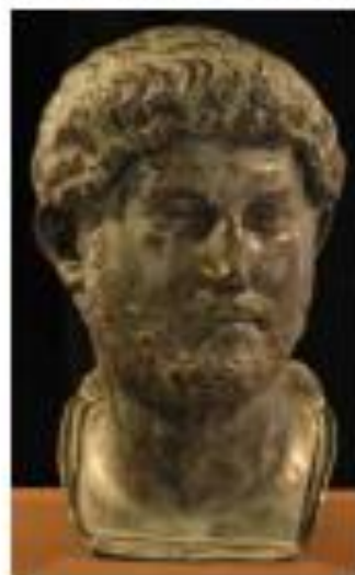
Busto del emperador Adriano, de origen español.

¿Cuál fue la razón que permitió que durante el Imperio se expandiera la ciudadanía?