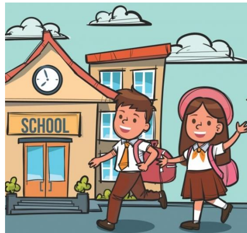
Go to school