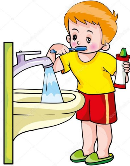
Brush my teeth