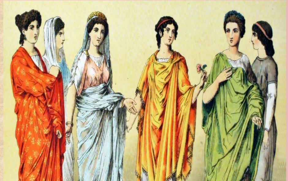
USO DEL PEPLO (CHAL DE LANA)