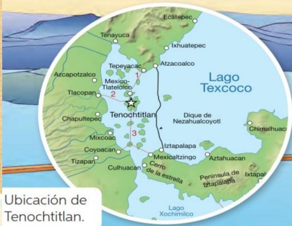
Ubicación de Tenochtitlan.