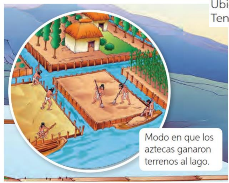
Modo en que los aztecas ganaron terrenos al lago.