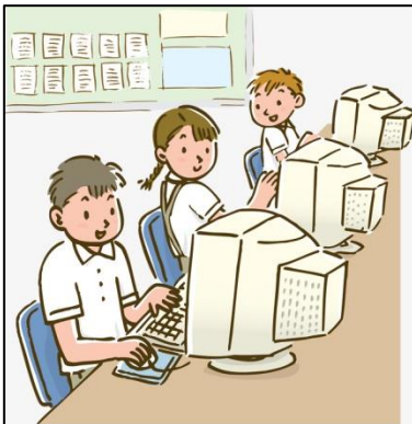
Computer Room (Sala de computación)