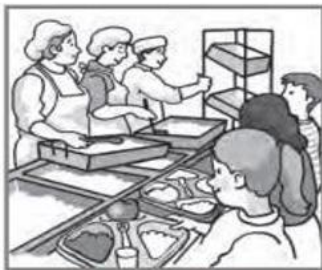
4 You eat lunch in the dining room.