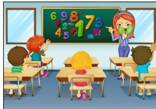
Class Room (Sala de clases)