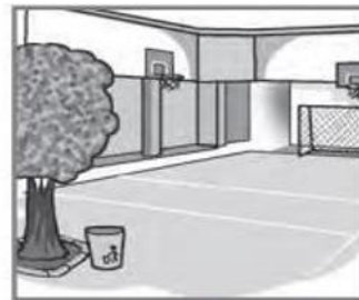
5 You play in the playground.