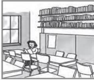
2 You read in the library.