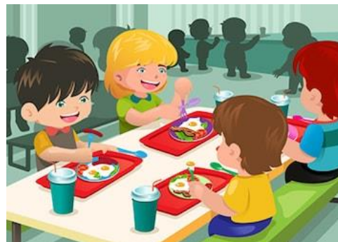
Dining Room (Casino)