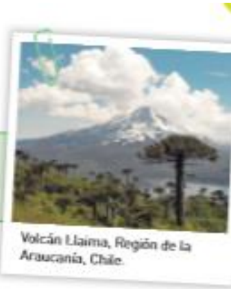
Volcán Llaima, Región de la Araucanía, Chile.

Volcán Villarrica: 2852 m. Volcán Osorno: 2664 m. Volcán Llaima: 3125 m.