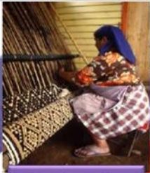
Tejiendo con lana