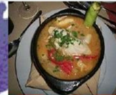
Caldillo de congrio