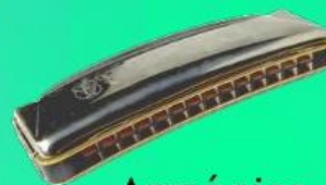
Armónica de boca