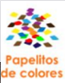
PapELITOS de colores

2.- ¿Qué materiales puedes utilizar para unir las partes?