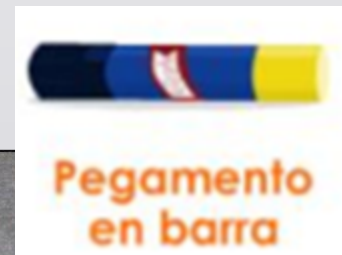
Pegamento en barra