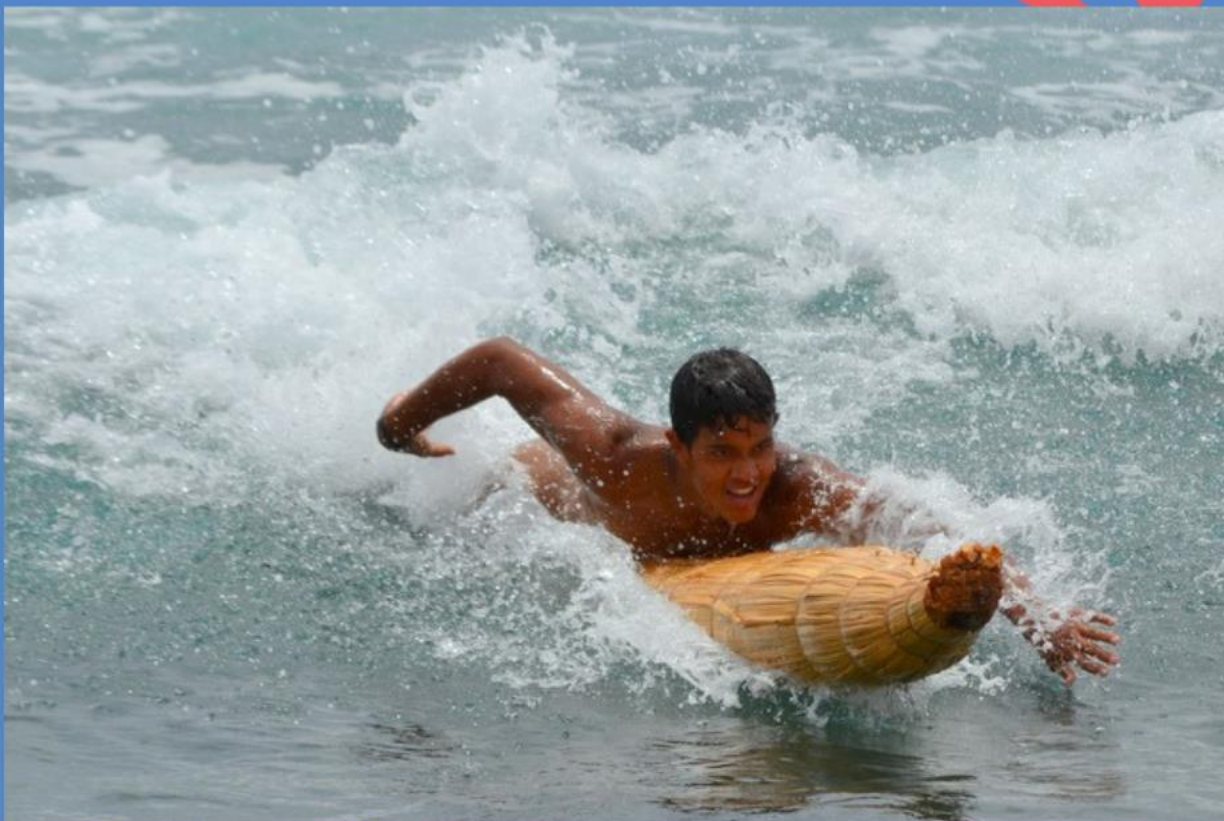
Haka Honu y Haka Ngaru