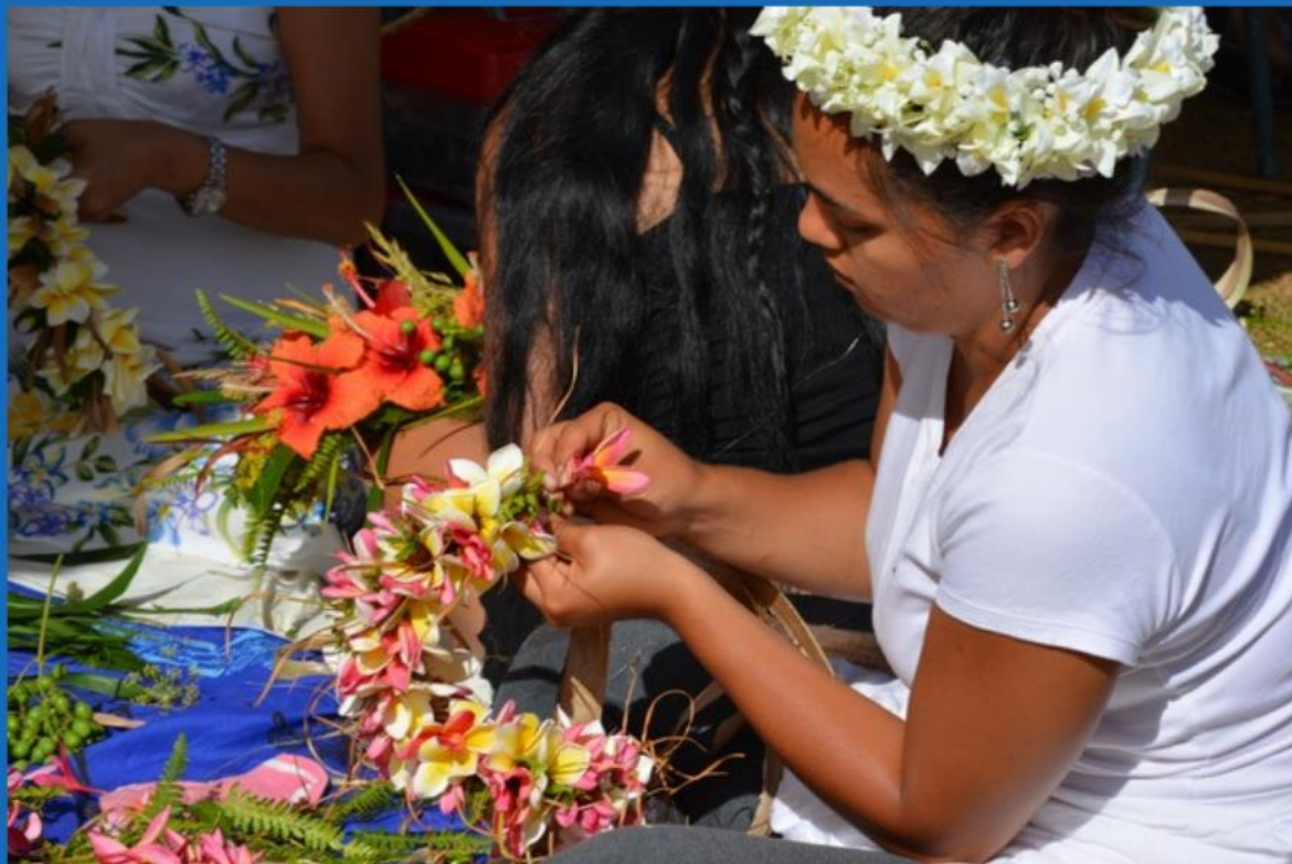
Confección de trajes tradicionales y collares de "Pipi" y de "flores"