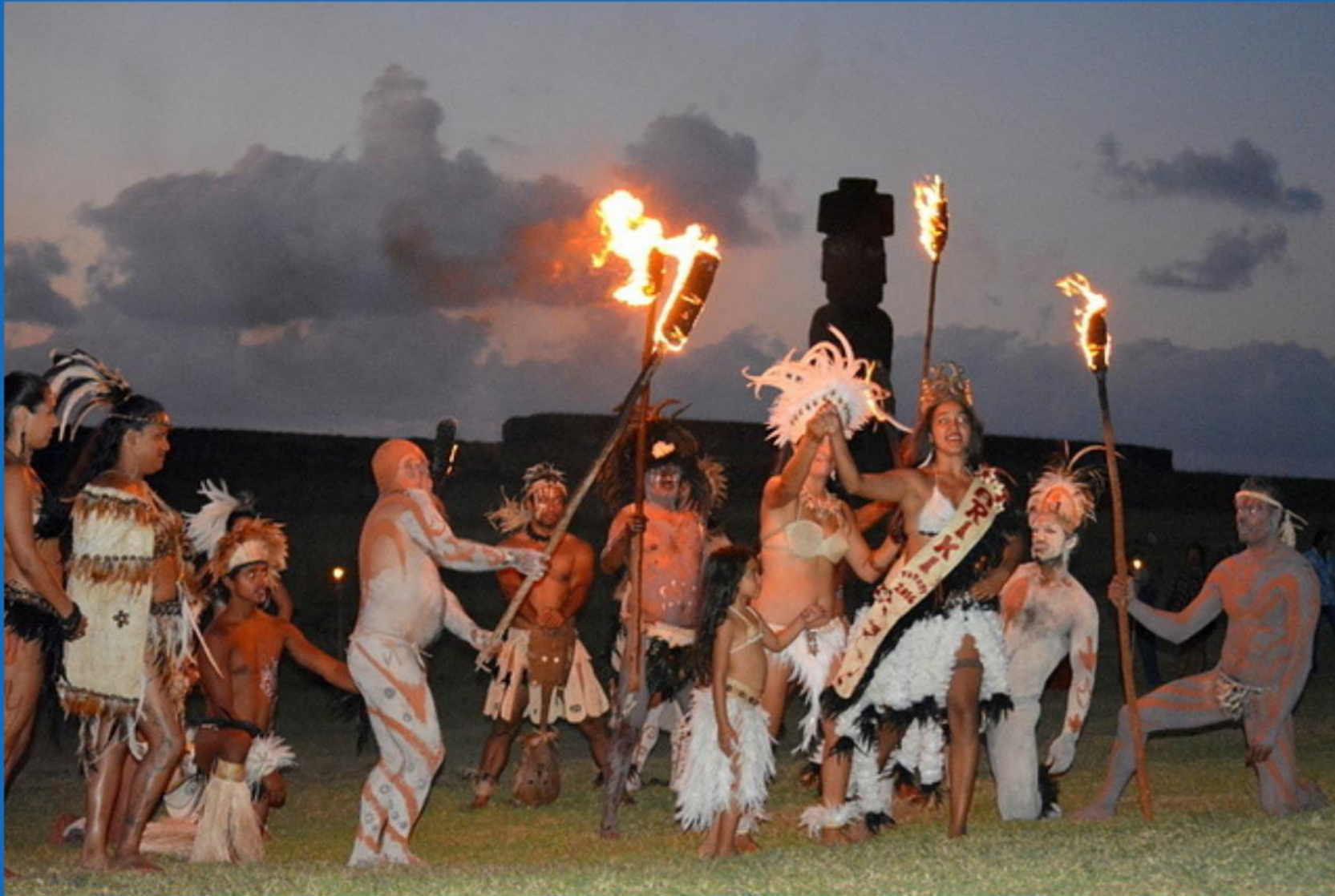
Coronación de la reina de la Tapati