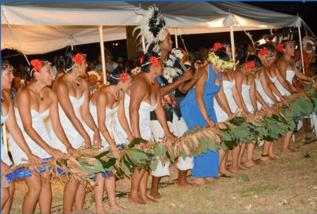
Koro Haka Opo