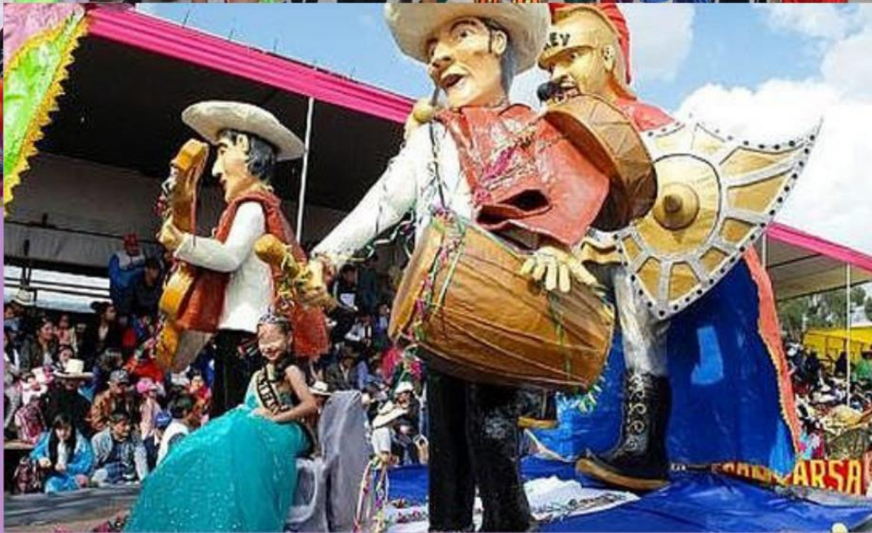
Carros alegóricos y representaciones