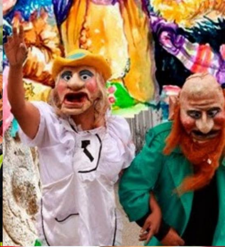
Y las infaltables máscaras que representan al Ño