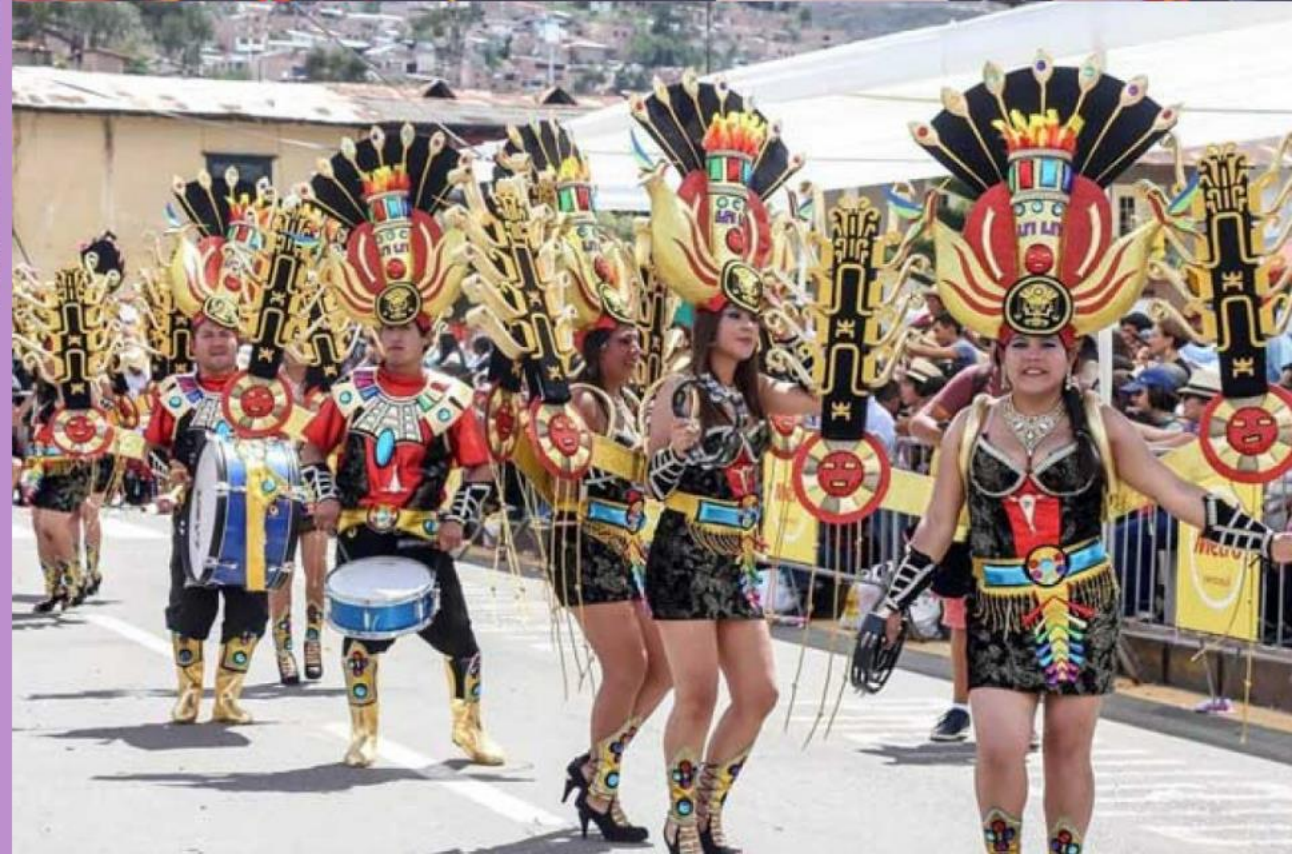
Sombreros y maquillaje