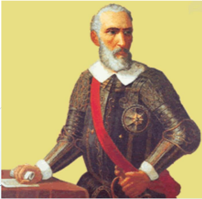
Martín Oñez de Loyola

https://www.youtube.com/watch?v=0Vb_BFqol8w