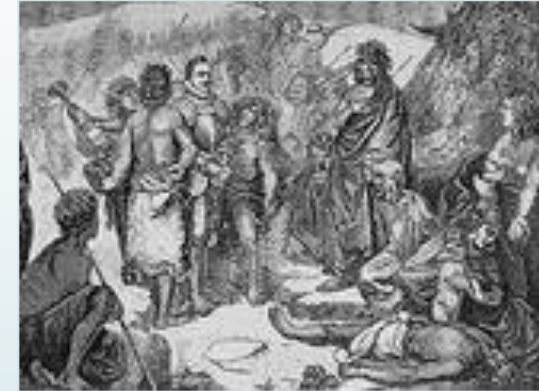
Valdivia es capturado y luego asesinado por los Mapuches al mando de Lautaro.