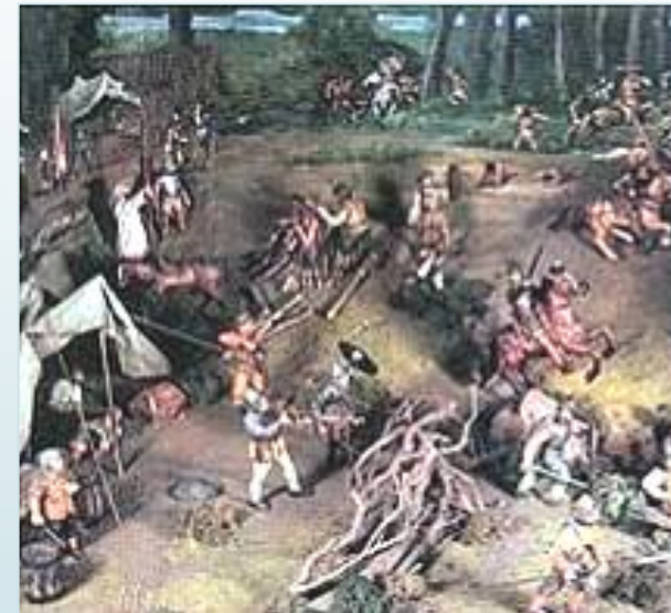
Batalla de Andalién, ocurrida en 1550 en lo que hoy es Concepción.