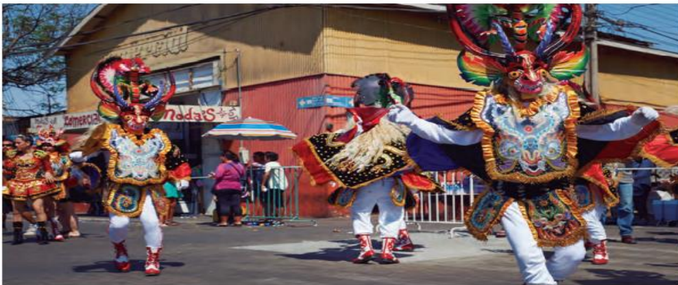
↑ Diablada de la Fiesta de la Tirana. La devoción por la Virgen del Carmen se masificó durante la Colonia. Además, la festividad posee fuertes influencias andinas.