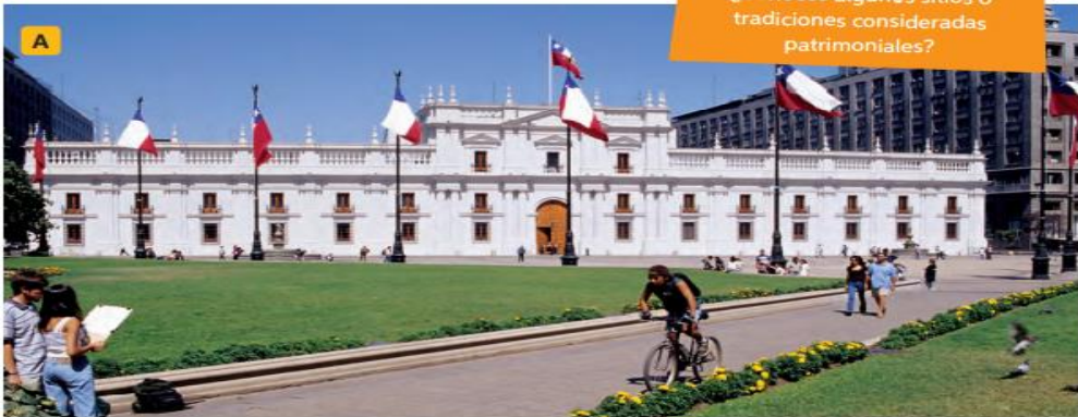
↑ Palacio de La Moneda, Santiago. Construido entre 1784 y 1805 (fines del periodo colonial).