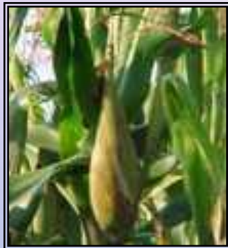
Maíz aporte mapuche