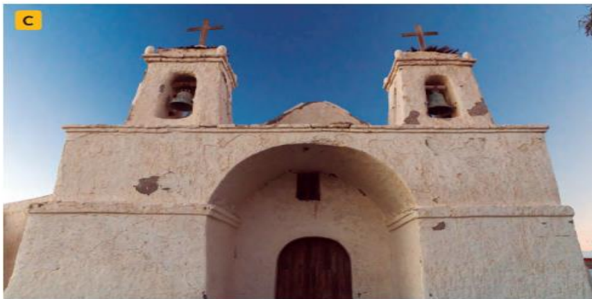
↑ La actual iglesia de San Francisco de Chiu Chiu, Región de Antofagasta. Su construcción data del siglo XVII.

¿Conoces algunos sitios o tradiciones consideradas patrimoniales?