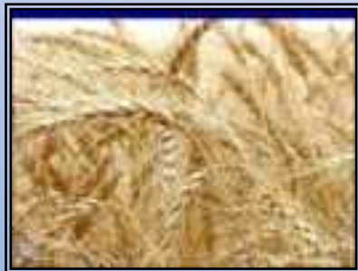
Trigo aporte español

❑ Su escenario principal fue el Valle Central.