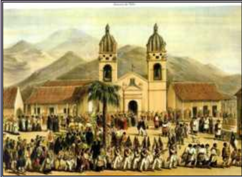
Religiosidad popular fiesta religiosa en Andacollo

❖ Se forma una nueva cultura y emergen nuevas formas de religiosidad como