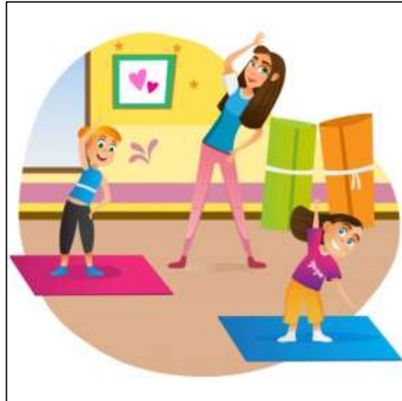
gym ( gimnasio)