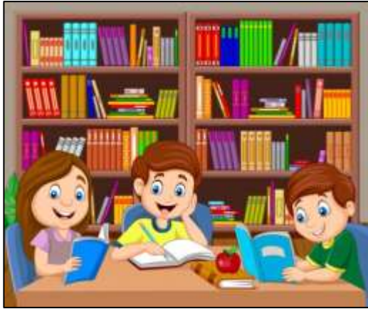
library ( biblioteca)