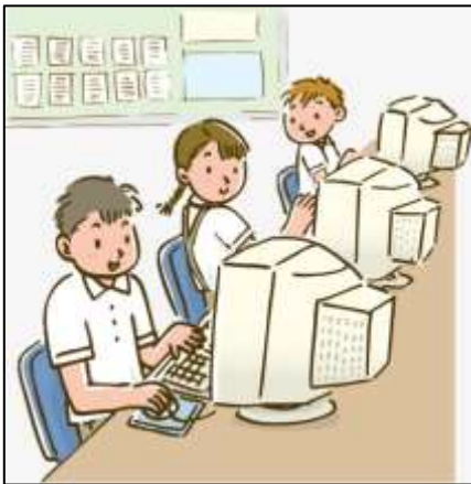
Computer Room (Sala de computación)