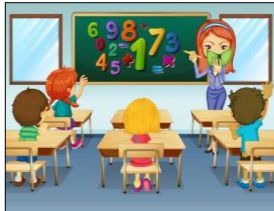
Classroom (Sala de clases)