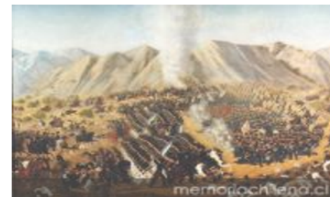
Batalla Chacabuco, 12 de febrero de 1817

Entre 1815 y 1817, Manuel Rodríguez logra llevar el orden entre las tropas realistas y organiza una red de correspondientes que se convertían, cuando las circunstancias lo requerían, en jefes de partidas volantes que aparecían y desaparecían como por arte de magia. El guerrillero era un genio del disfraz y escurridizo como un fantasma. Su osadía llegó al punto de abrirle la puerta del carruaje al mismísimo Casimiro Marcó del Pont a la salida del edificio gubernamental y además recibir una moneda por el servicio de parte del gobernador. Pronto la figura del Montonero adquiere el relieve y la aureola de la leyenda con sus acciones revolucionarias a las mismas espaldas de los realistas. Sus hazañas fueron la comida de las tertulias populares del pueblo.