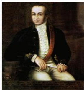
Casimiro Marcó del Pont

Luego de la Batalla de Rancagua, Mariano Osorio asume la Gobernación de Chile. El gobernador reinstaura el antiguo régimen y todas sus instituciones. De igual forma disuelve todo lo instaurado por los "patriotas" durante el periodo de la Patria Vieja. Osorio, a pesar de haber ordenado la deportación de una centena de notables patriotas al Archipiélago de Juan Fernández, intentó llevar a cabo conscientemente un gobierno de reconciliación entre los bandos enfrentados (patriotas y realistas); por eso ordenó el tribunal encargado de enjuiciar a posibles antiguos patriotas, con vecinos benevolentes que perdonaron en reiteradas ocasiones.