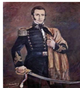
Manuel Rodríguez Erdoiza

Durante su gobierno se llevó a cabo una represión brutal a todos los que habían participado en el movimiento independentista. Algunos notables fueron deportados al Archipiélago de Juan Fernández y otros sufrieron las vejaciones y humillaciones del tristemente famoso Regimiento Los Talaveras de la Reina, a cargo del Capitán Vicente San Bruno. Su mandato fue muy resistido por la población debido a la acción represiva, su odiosa gestión administrativa y a la estigmatización de su refinada figura. Manuel Rodríguez, el patriota a cuya cabeza le tenía puesta una recompensa, alguna vez le abrió la puerta de calesa, en la Plaza de Armas, obteniendo una moneda del gobernador.