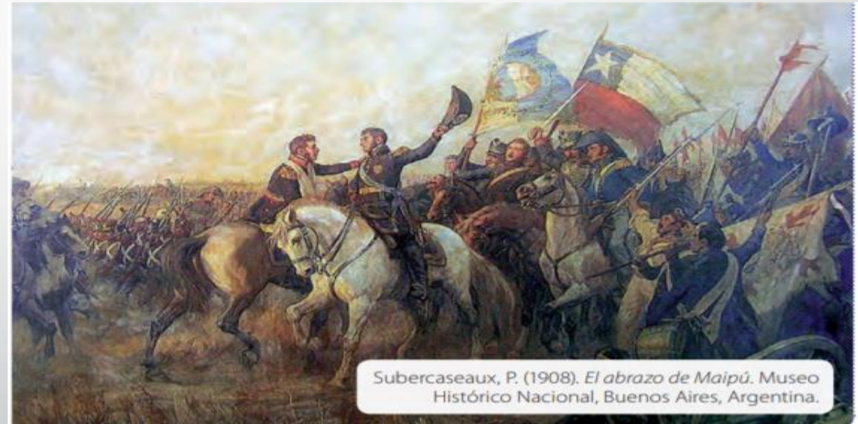
Subercaseaux, P. (1908). El abrazo de Maipú . Museo Histórico Nacional, Buenos Aires, Argentina.

¿Por qué es importante la batalla de Maipú? Fundamente su respuesta