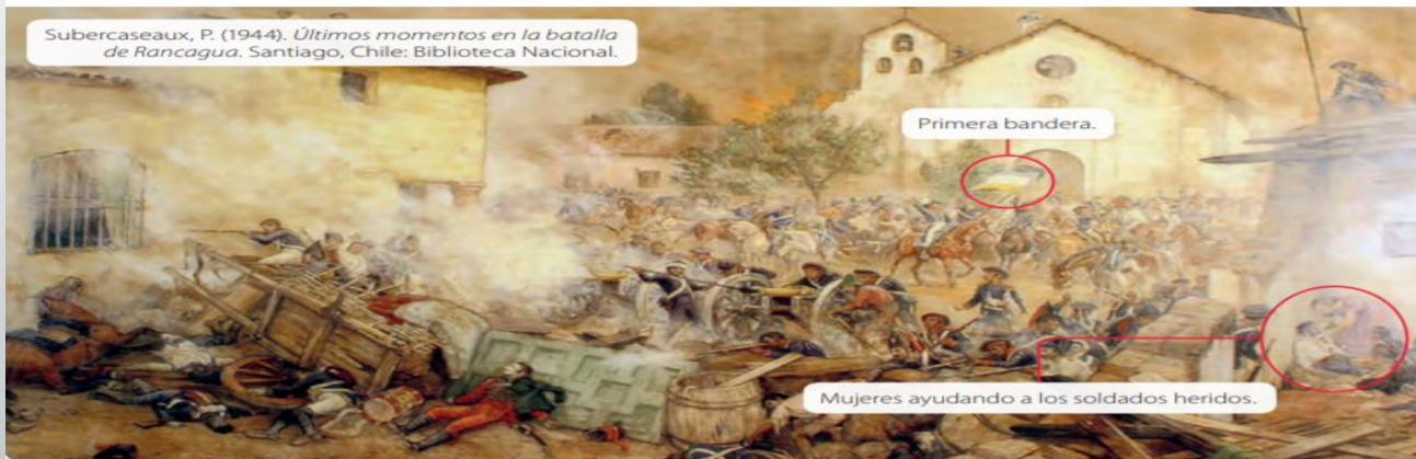
Subercaseaux, P. (1944). Últimos momentos en la batalla de Rancagua . Santiago, Chile: Biblioteca Nacional.

3 Vuelve a observar la pintura del Recurso 3 y responde: ¿qué te hace sentir esta obra?, ¿crees que es un buen retrato de las consecuencias de la batalla de Rancagua?