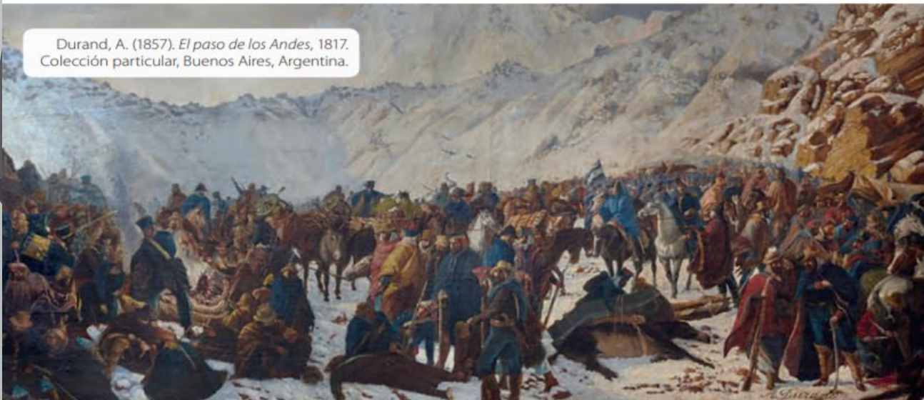
Durand, A. (1857). El paso de los Andes, 1817 . Colección particular, Buenos Aires, Argentina.

La formación del Ejército Libertador fue una de las acciones realizada por los criollos chilenos y argentinos para terminar con el dominio de la Corona española. Entre enero y febrero de 1817, el Ejército Libertador se enfrentó a los realistas en la batalla de Chacabuco, logrando una victoria decisiva para la independencia de Chile y América.