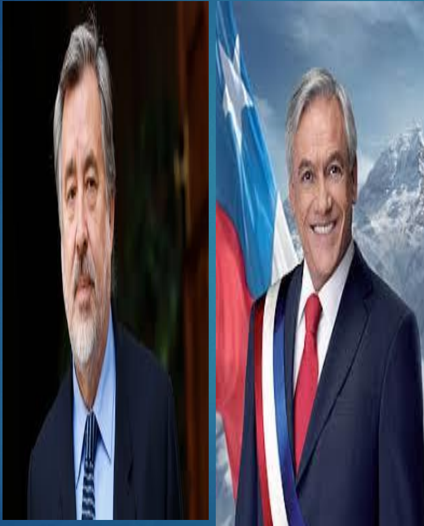
Alejandro Guillier- Sebastián Piñera

La ley señala que será elegido( a) presidente(a) de la República el candidato que tenga el 50%+1 voto