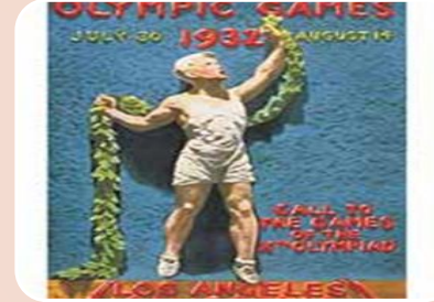
Los Ángeles 1932