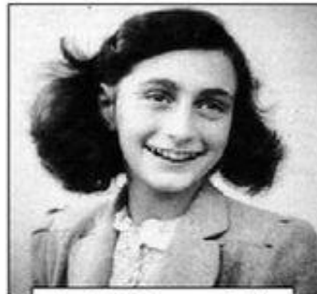
Junio, 1929 – marzo, 1945

3. La familia de Ana se escondió para escapar de _____