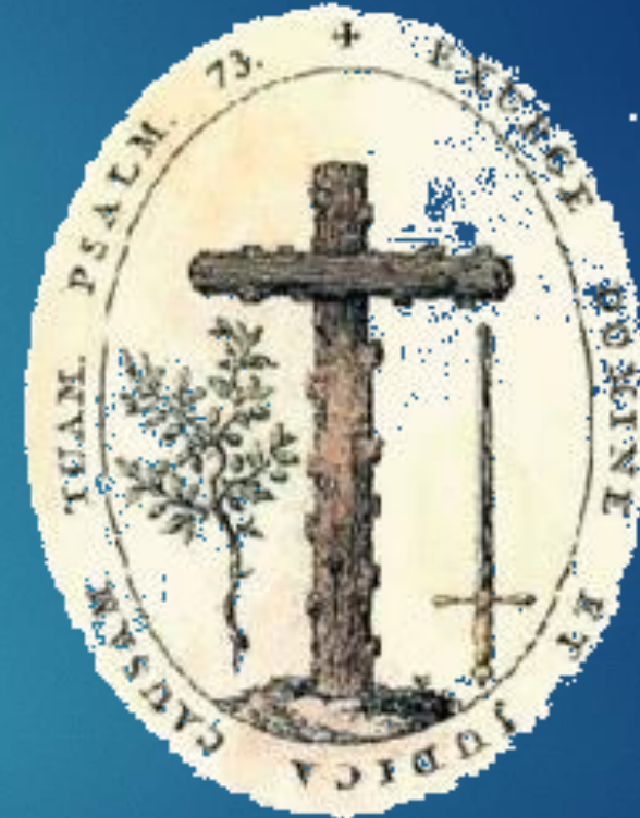
Escudo de la Inquisición española. La espada simboliza el trato a los herejes y el olivo, la reconciliación con los arrepentidos.