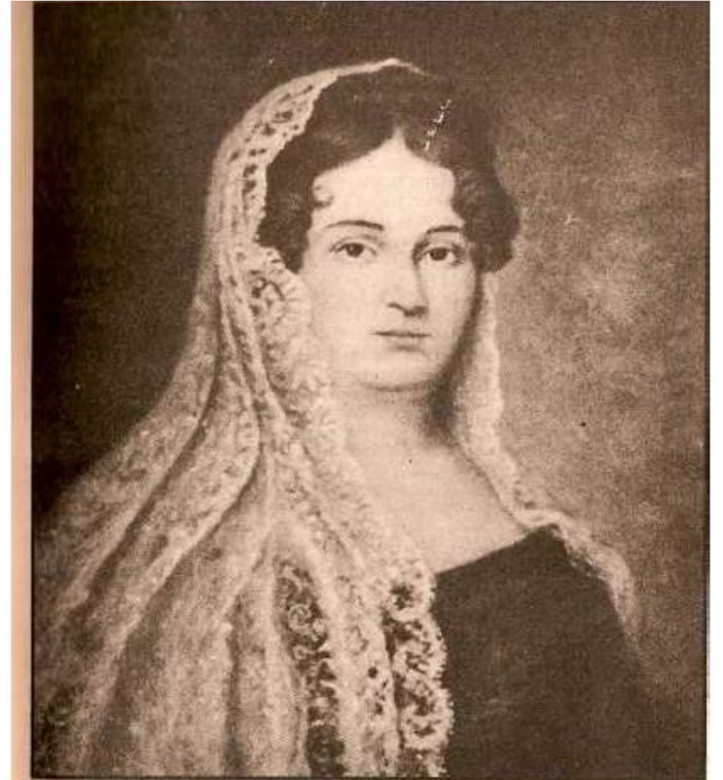
Doña Javiera Carrera.

“Heroína de la independencia de Chile. ... Al estallar la revolución independista en 1810, la familia Carrera , con Javiera a la cabeza, tomó partido por los insurrectos. En 1812 la fama de Javiera como ferviente defensora de la independencia era conocida por todo el país.”