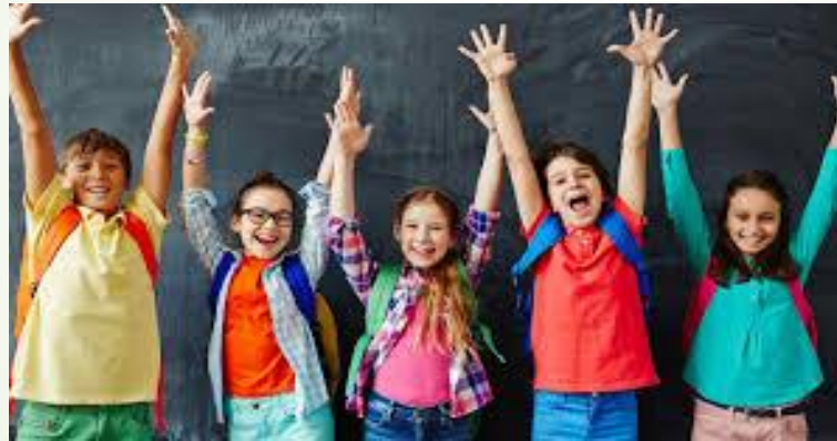
Equipo Convivencia Escolar 2020