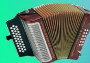
Upa - Upa