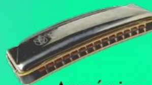
Armónica de boca