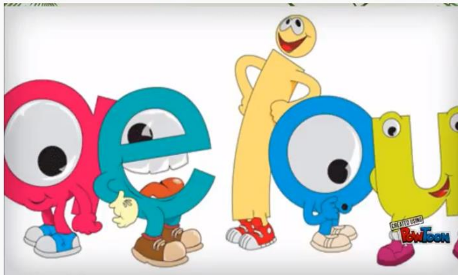
Cuento las vocales